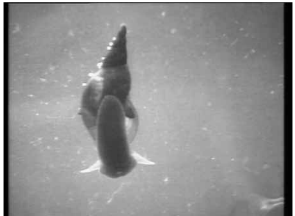
Opname van beestje uit de sloot, in het aquarium in AVONTUREN OP HET LAND.

Het streven naar perfectionisme zit dus eerder in het kunnen vangen van een moment dan in een vlekkeloos afgewerkte eindmontage. Volgens Van der Elskenskenner Jan-Christopher Horak heeft dit gebrek aan perfectionisme te maken met zijn opvattingen over schoonheid. 14 In de jaren zestig heeft Van der Elskens gretig de