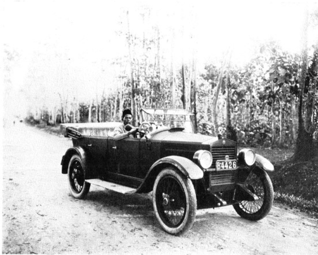
☒ DE ESSEX-WAGEN WAARIN DE REIS DOOR INDIË WERD GEMAAKT MET DEN MALEISCHEN CHAUFFEUR SAIMOEN ☒ ☒ ☒ ☒ ☒ ☒ ☒ ☒ ☒ ☒ ☒ ☒

Afbeelding 1. Uit: Elout , Indisch dagboek, 4.