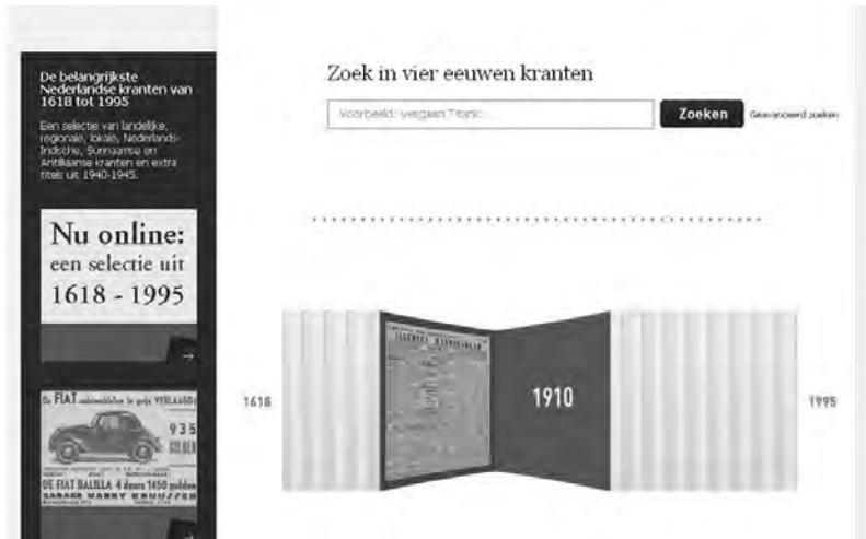
Homepage van de site Historische Kranten van de Koninklijke Bibliotheek .