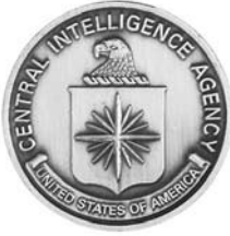
CIA-logo van de Central Intelligence Agency