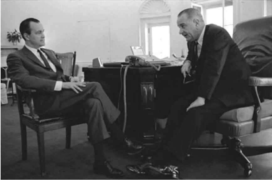
Directeur Richard Helms en president Lyndon B. Johnson in overleg, april 1965.

werden duizenden medewerkers bespioneerd, vaak in samenwerking met de FBI die voor dit doel de geheime operatie COINTELPRO had opgezet. MHCHAOS werd ontmaskerd in de reeks van CIA-schandalen die begon met de onthulling van de CIA-betrokkenheid bij de befaamde inbraak in het Watergate-gebouw op 17 juni 1972.