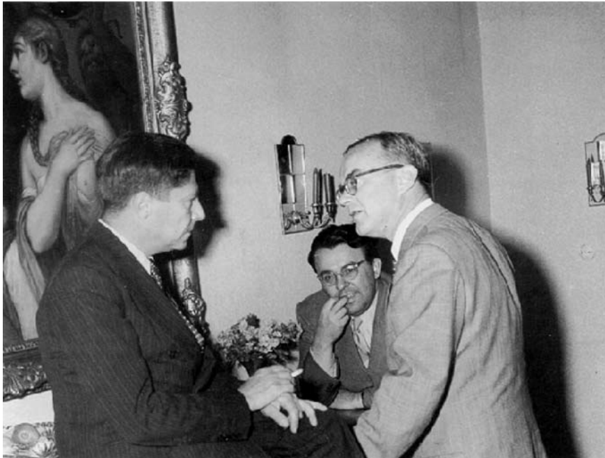
Arthur Koestler, Irving Brown en James Burnham tijdens de oprichtingsbijeenkomst van het CCF.