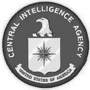
Logo van de Central Intelligence Agency

stond in de onthullingen, de NSA met als achterban honderdduizenden studenten die zich in toenemende mate verzetten tegen het Vietnambeleid van de regering-Johnson. Voor deze groep en de daarmee verbonden New Left intelligentsia was de onthulling van de CIA-financieringen een extra argument in hun strijd tegen het regeringsbeleid. Lull en Hineman's stelling dat een schandaal niet alleen door de media gemaakt wordt maar ook door het publiek, gaat in dit geval dan ook zeker op. 60