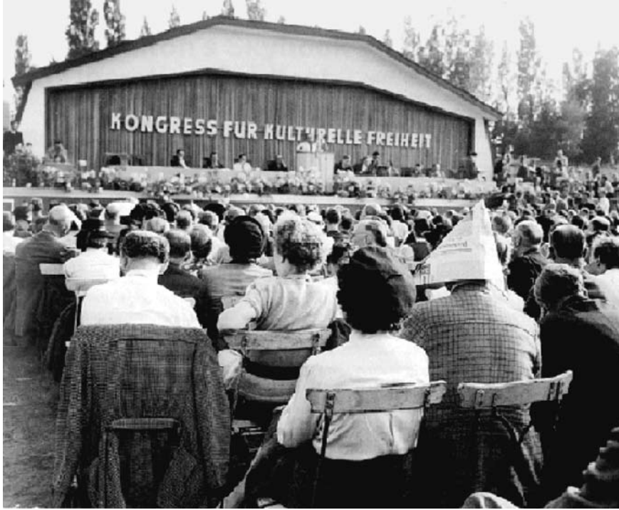
Slotzitting van de oprichtingsbijeenkomst van het Congress for Cultural Freedom, Berlijn 29 juni 1950.