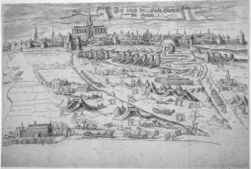
Het oorlogsterrein rond Haarlem tijdens het beleg. Gravure door Herman Muller naar Maerten van Heemskerk.

wereld afgesloten was. Een dagverhaal uit Haarlem geeft aan dat de omsingeling zo waterdicht was