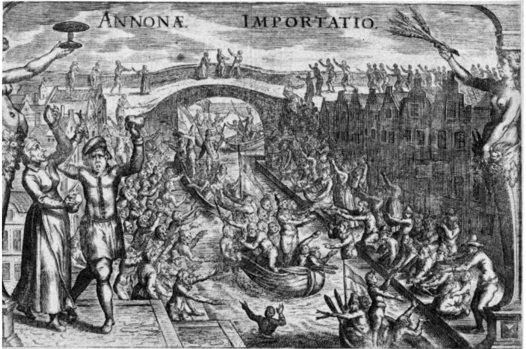
De geuzen delen haring en wittebrood uit. Gravure uit J.J. Orlers, Beschryvinghe der stadt Leyden, 1614.

aan de prins. Het was waarschijnlijk de bedoeling dat de brief in de handen van de Spanjaarden zou vallen om hen op het verkeerde been te zetten. 50