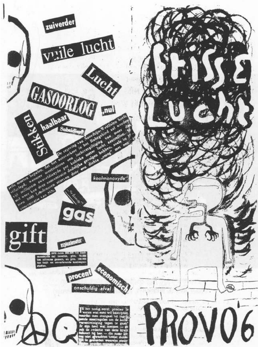
Omslag van Provo nummer 6, januari 1966 (uit: Niek Pas, Imaazje!)

waren provo's niet alleen afschrikwekkende representanten van het 'langharig, werkschuw, tuig', buitenissigheden of simpele nieuwsfeiten, maar in toenemende mate ook gesprekspartners en ervaringsdeskundigen. Ze werden benaderd om het verwarde maatschappelijke klimaat dat Nederland in zijn greep kreeg, vanaf de rookbommen en rellen tijdens het huwelijk van prinses Beatrix en Claus von Amsberg (maart 1966) tot de ernstige ongeregelde heden tijdens bouwvakkersrellen in Amsterdam (juni 1966), mede te duiden. Over het algemeen vonden ze deze exposure prima; ze konden hun kritiek spuien en hun boodschap uitdragen, als altijd via een mix van ernst en spot.