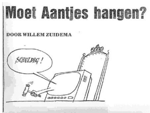
Hervormd Nederland 18 november 1978