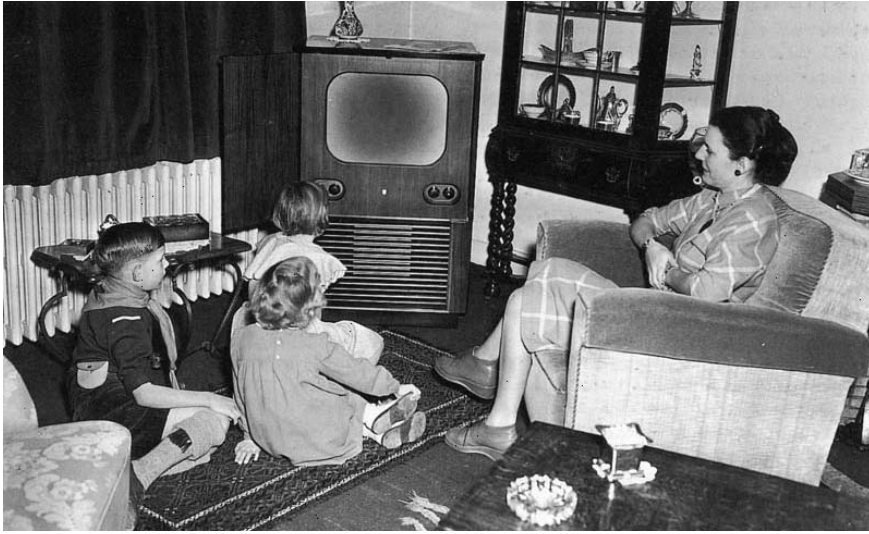
Moeder en kinderen voor televisietoestel op 26 januari 1952.