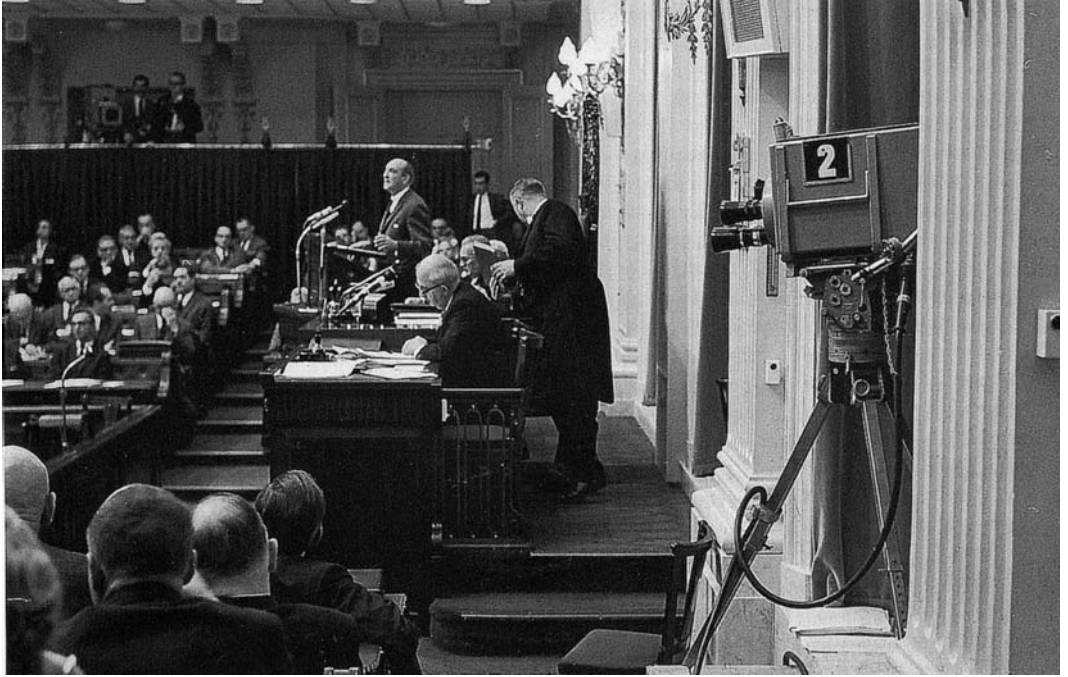
Een NTS-camera in de Tweede Kamer, omstreeks 1966.

zijn rol als formateur. De berichtgeving van het JOURNAAL bleef droog, zonder de dramatische aspecten van de kabinetscrisis in beeld te brengen. Hiermee verschilde het JOURNAAL sterk van de actualiteitenrubrieken, die de nadruk legden op Schmelzers optreden tijdens ‘zijn’ Nacht en de spanningen die daardoor veroorzaakt waren. 15