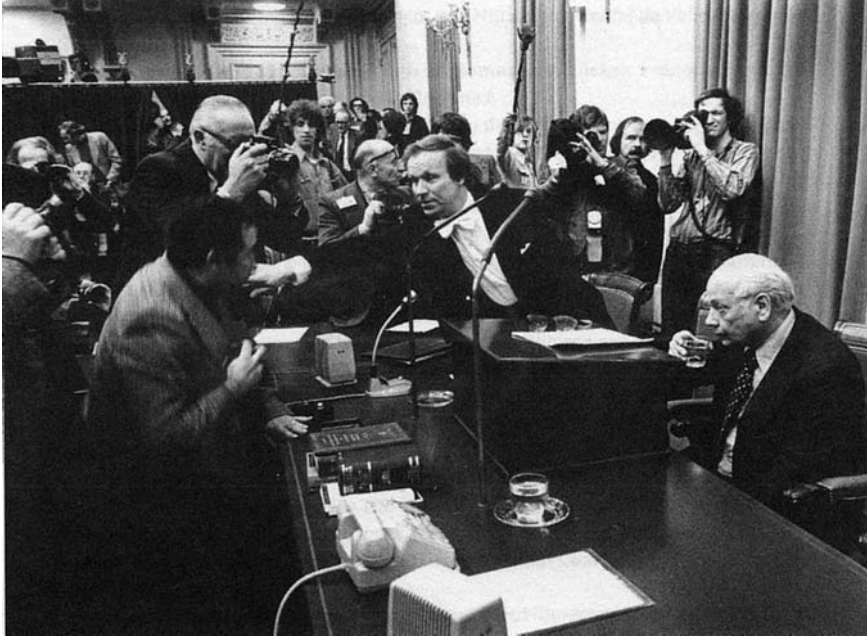
Minister-president Joop den Uyl omringd door journalisten bij de bekendmaking van de val van zijn kabinet, 22 maart 1977.

omdat het JOURNAAL zich niet meer liet 'overvallen' door kabinetscrisis, maar erop anticepeerde. De journalisten wachtten de gebeurtenissen niet meer af, maar gingen zelf achter het nieuws aan.